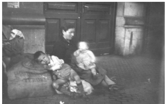
Abbildung 1 Flüchtlinge im spanischen Bürgerkrieg

Ich meldete mich spontan. Nicht aus politischen Motiven, auch nicht aus menschlichem Mitgefühl, sondern eher aus Lust am Abenteuer. Zu meinem Erstaunen wurde ich angenommen und nach einer kurzen Aussprache mit der Präsidentin auf die Reise geschickt.